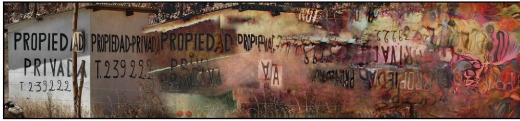
Propiedad Privada (2007)

gehalte aan improvisatie, en vanuit een houding die de auteur als unieke en oorspronkelijke bron van het werk betwijfeld.